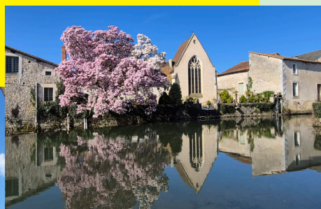
Château de SAVEILLES XVème - XVIème siècles